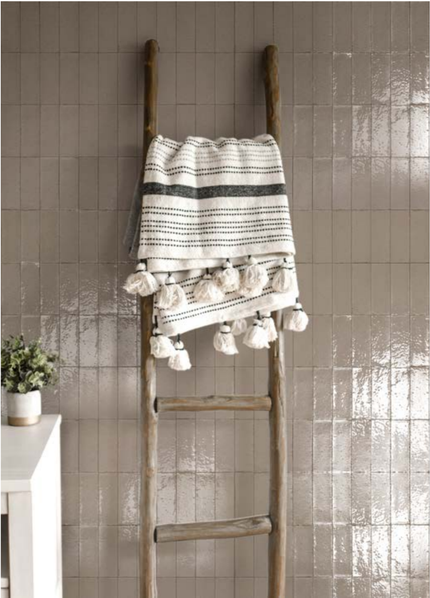
RAEW Glacé Mastice Glossy 7x20cm