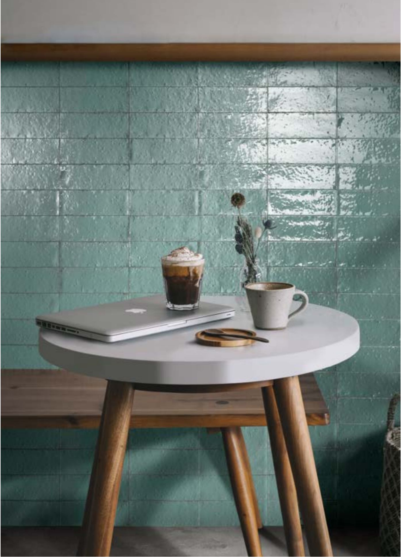
RAEY Glacé Turchese Glossy 7x20cm - RAQ2 Clayton Smoke Rt 100x100cm