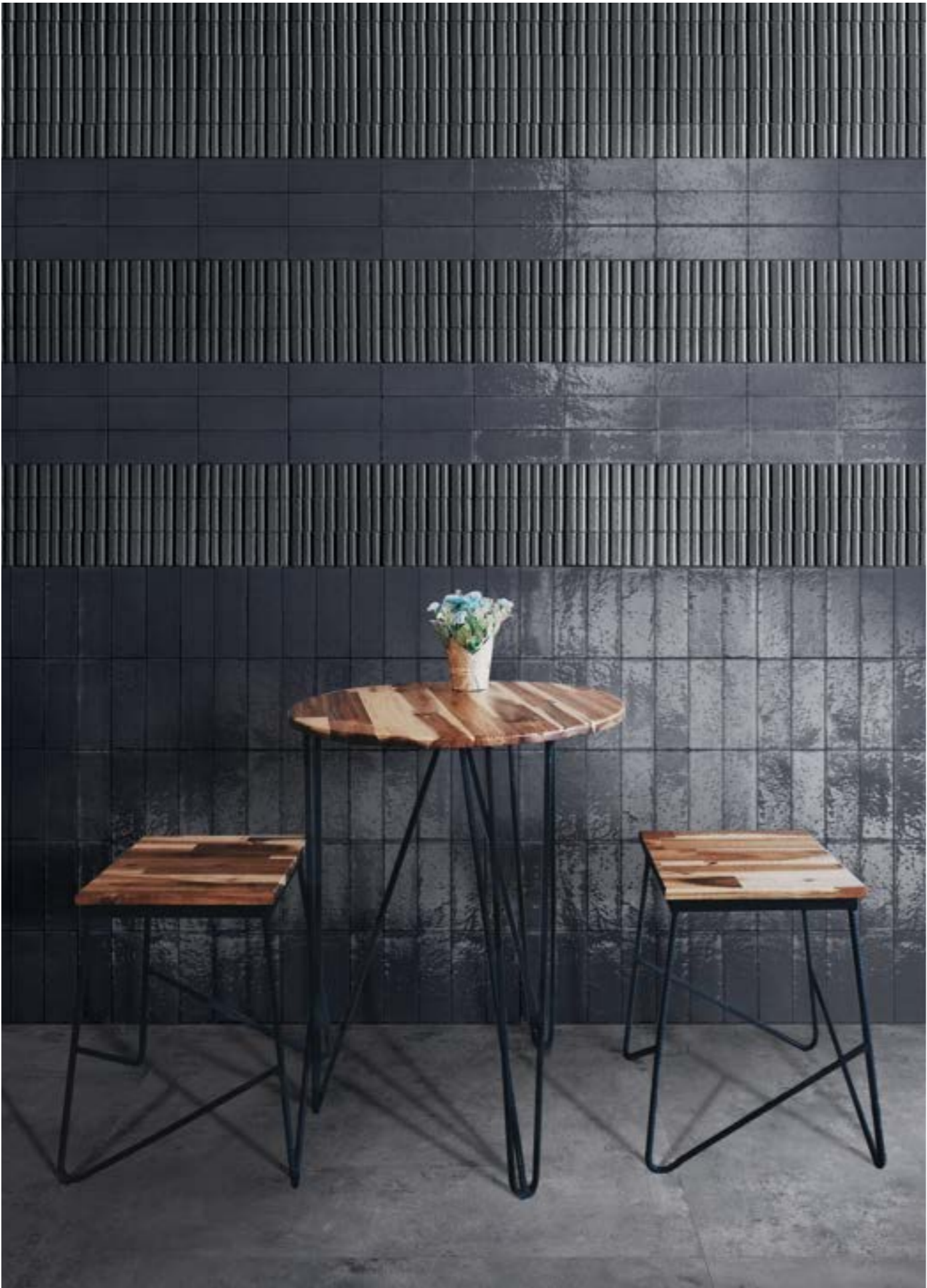
RAER Glacé Blu Notte Glossy Struttura Rayé 7x20cm - RAF0 Glacé Blu Notte Glossy 7x20cm - RAQ2 Clayton Smoke Rt 100x100cm