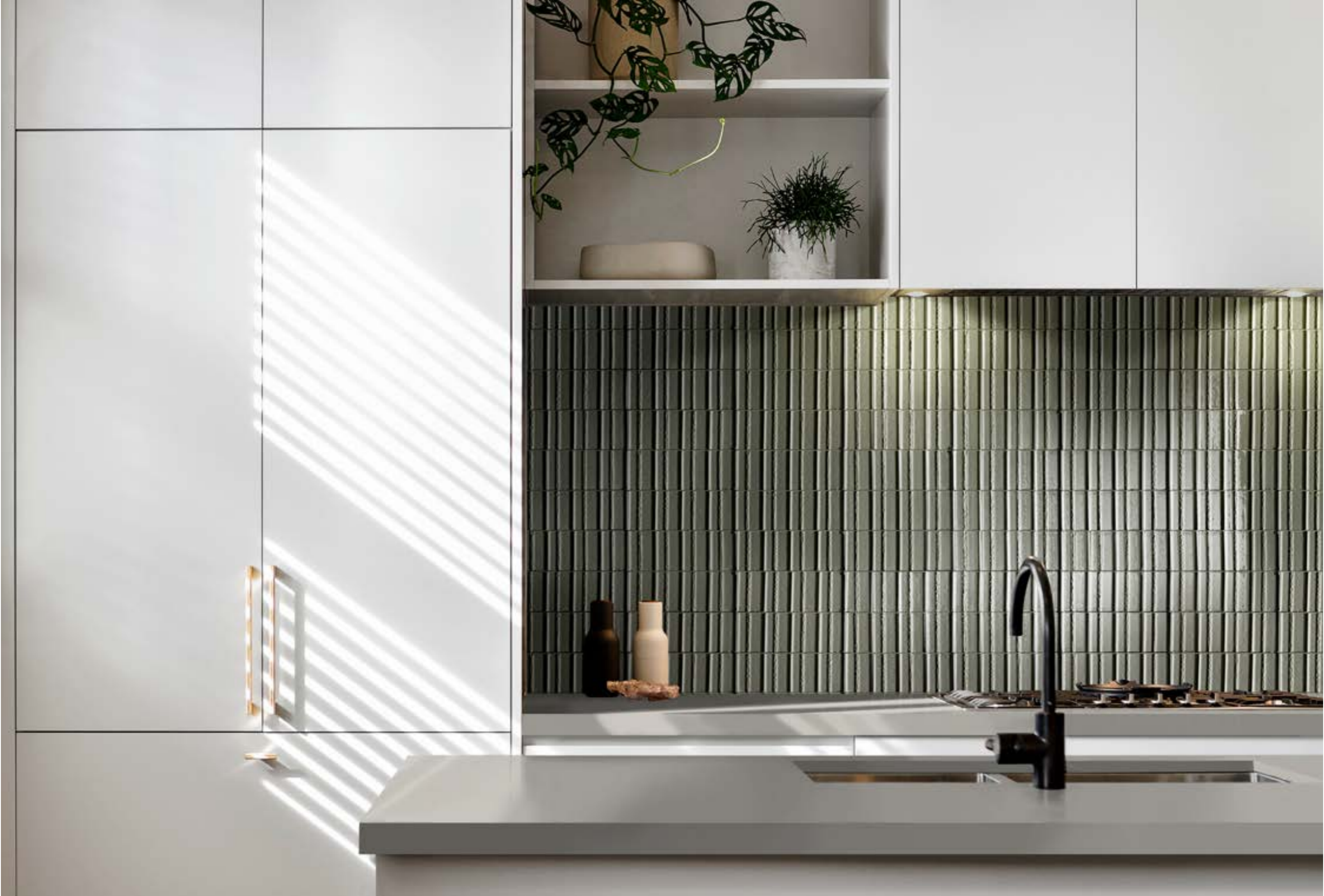
RAEN Glacé Muschio Glossy Struttura Rayé 7x20cm