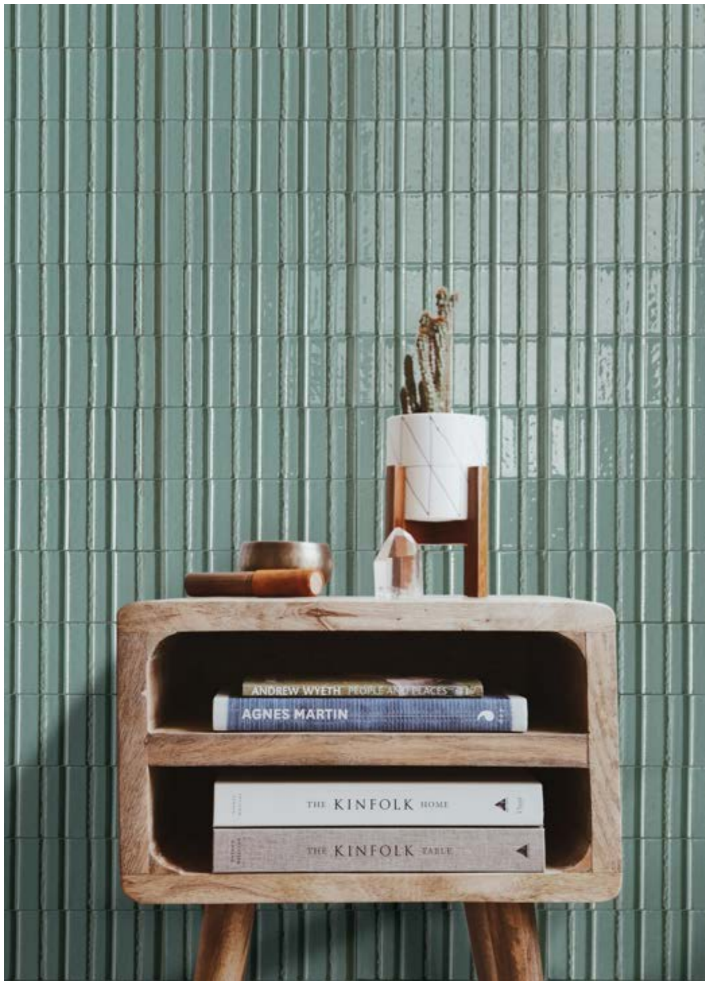
RAEP Glacé Turchese Glossy Struttura Rayé 7x20cm