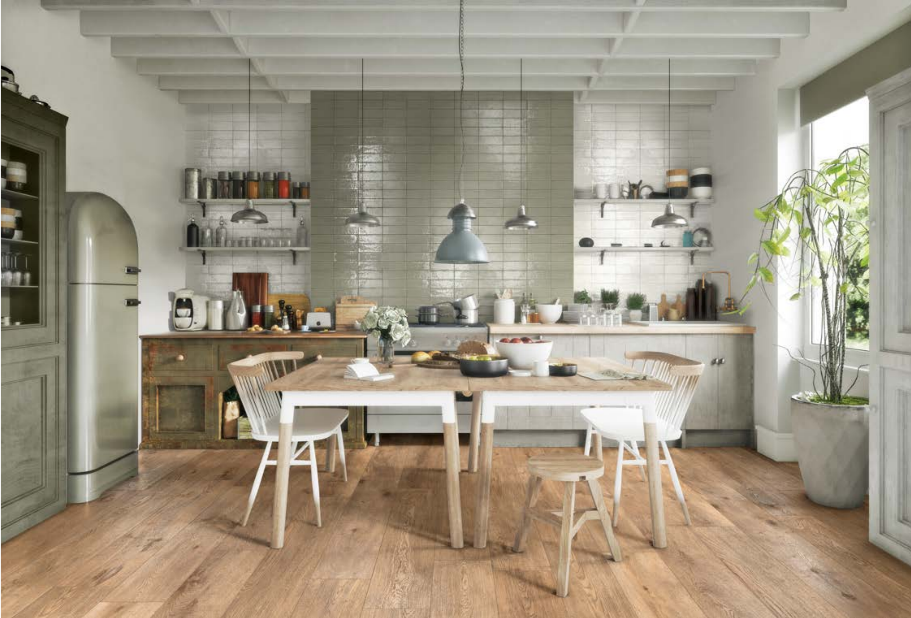
RADN Inedito Nocciola Rt 25x150cm - RAEV Glacé Bianco Glossy 7x20cm - RAEX Glacé Muschio Glossy 7x20cm