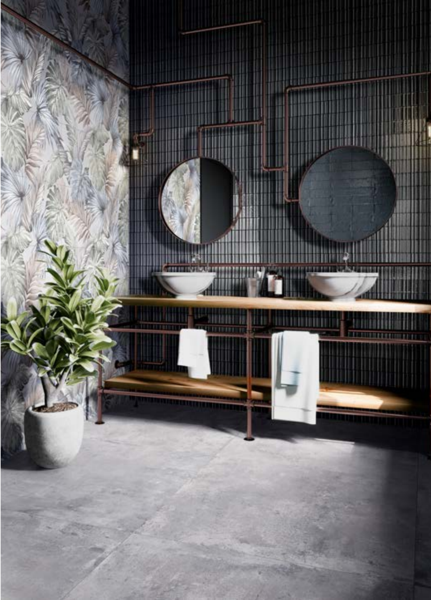
RAER Glacé Blu Notte Glossy Struttura Rayé 7x20cm - RAQ1 Clayton Iron Rt 100x100cm - RCR2 Clayton Decoro Mural Touch Set Rt 33x100cm