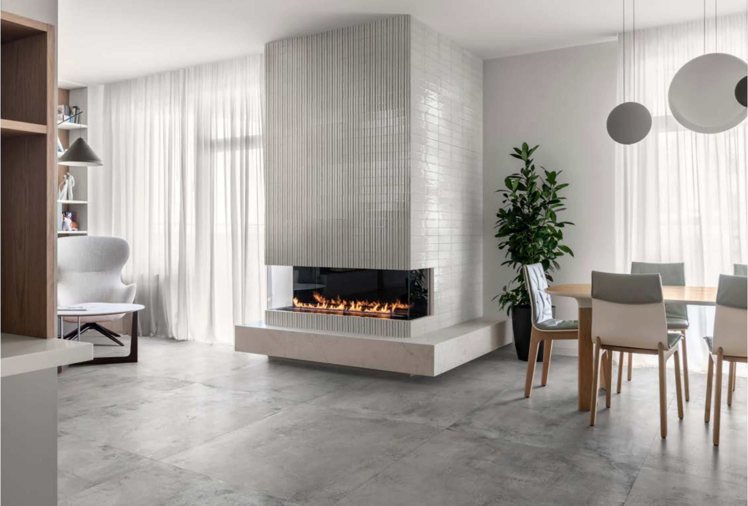
RAEL Glacé Bianco Glossy Struttura Rayé 7x20cm - RAEV Glacé Bianco Glossy 7x20cm - RAQ1 Clayton Iron Rt 100x100cm