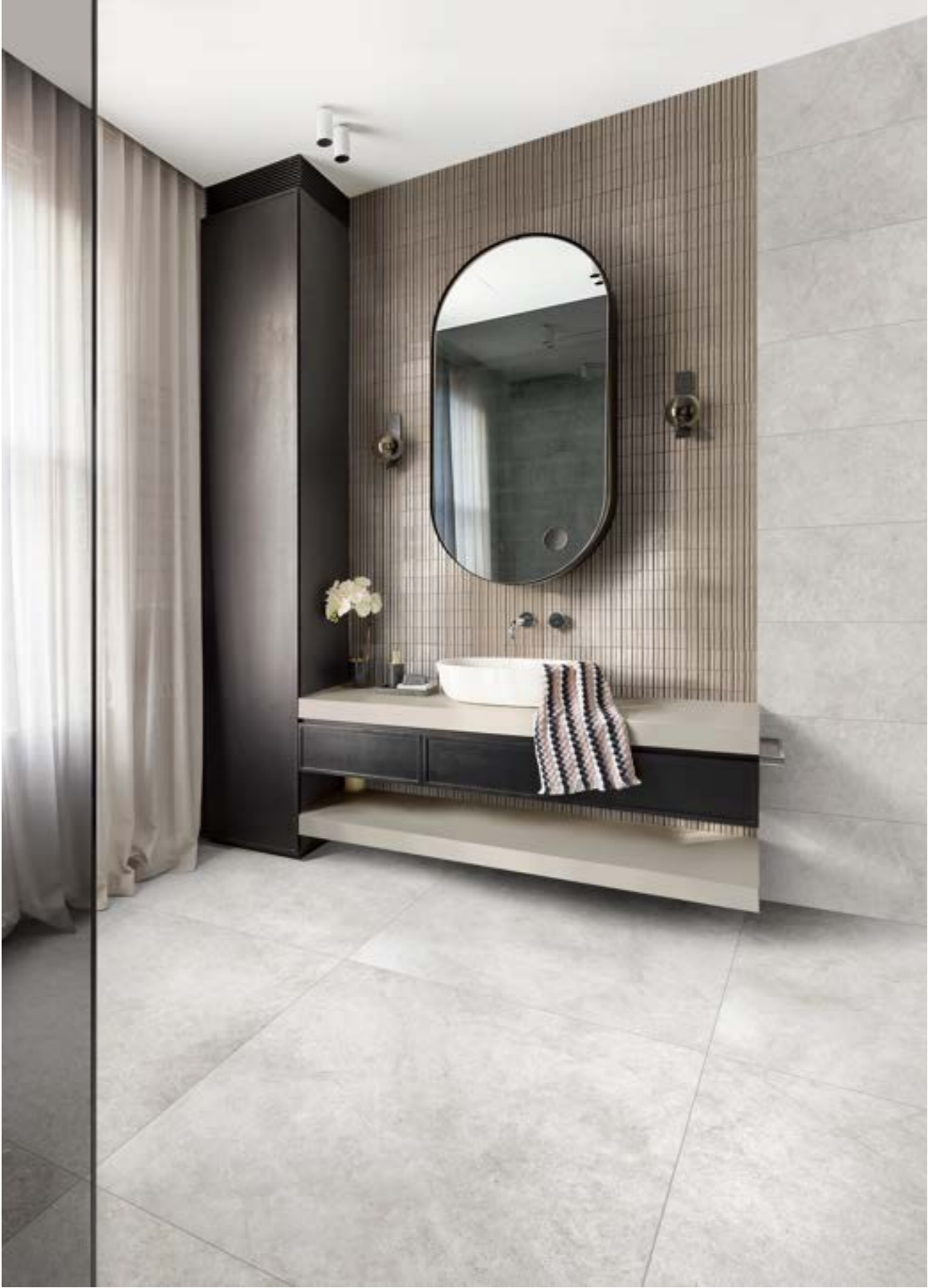
RACU Richmond Ivory Rt 33x100cm - RAEM Glacé Mastice Glossy Struttura Rayé 7x20cm - RALJ Richmond Ivory Rt 100x100cm