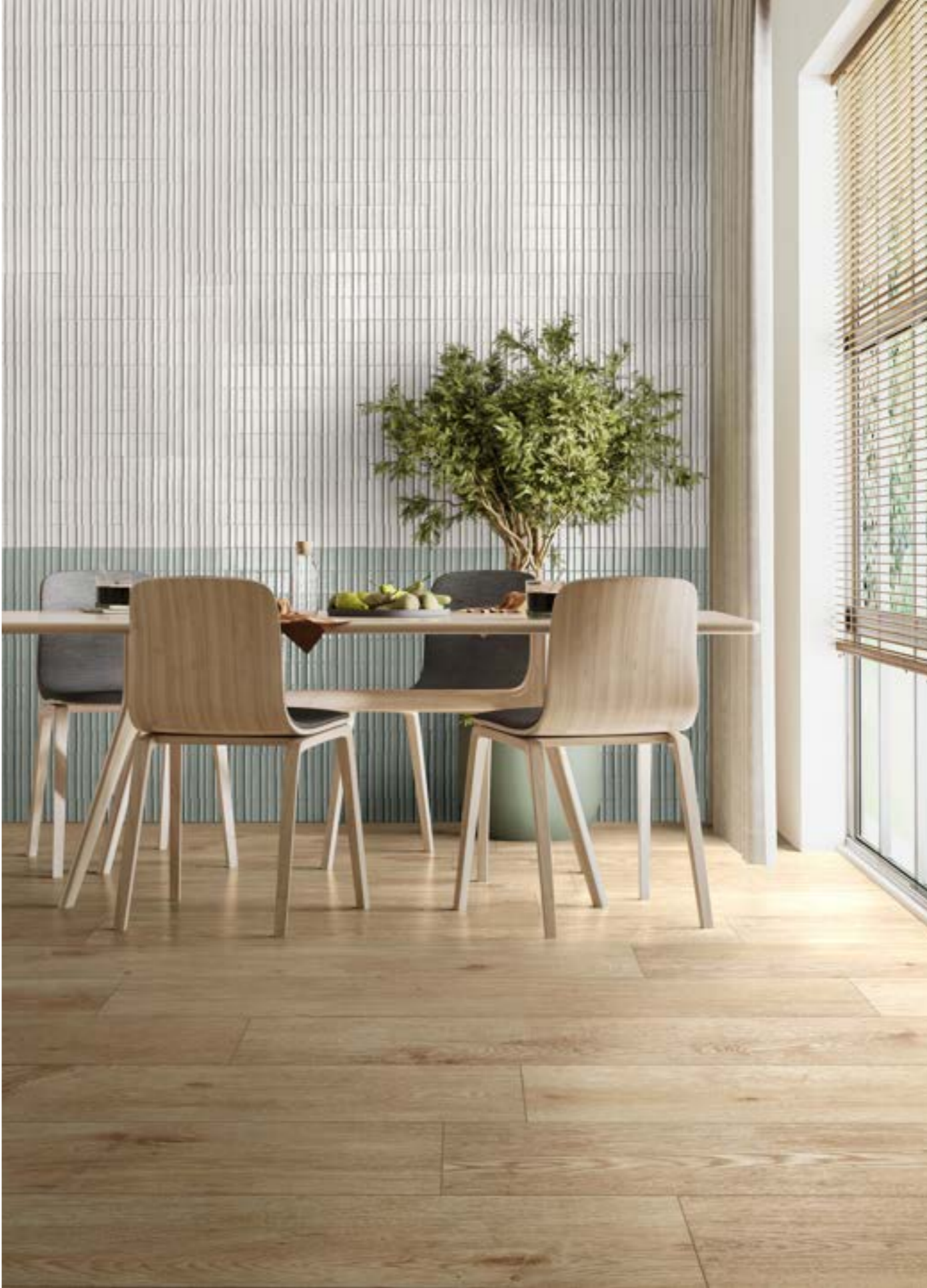
RADL Inedito Avorio Rt 25x150cm - RAEL Glacé Bianco Glossy Struttura Rayé 7x20cm - RAEQ Glacé Avio Glossy Struttura Rayé 7x20cm